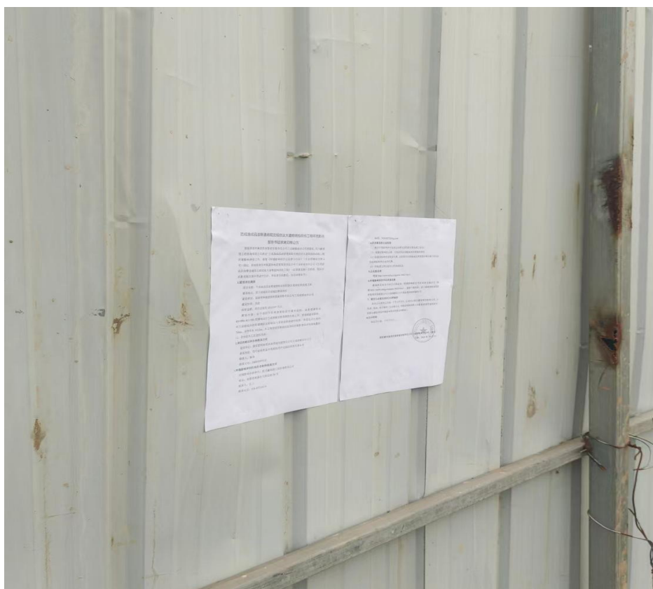
图 4.2.3-1 征求意见稿信息张贴现场照片