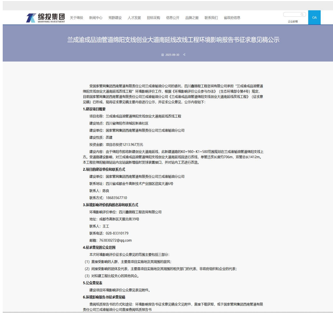
图 3.2.1-1 征求意见稿信息公开截图

绵投集团网是公开平台，符合《环境影响评价公众参与办法》第十一条的规定。本次信息公示内容包括：《兰成渝成品油管道绵阳支线创业大道南延线段改线工程环境影响报告书环境影响报告书》（征求意见稿）、建设项目环境影响评价公众意见表，公示有效时间 10 个工作日，满足《环境影响评价公众参与办法》规定。